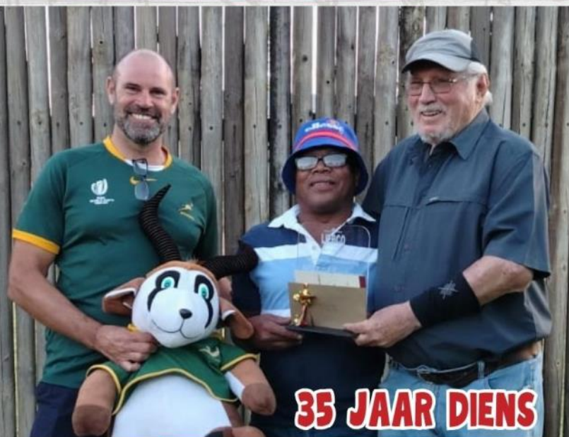
35 JAAR DIENS

BOKKIE HET SAAM MET LIEBCO DIE SPRINGBOKKE ONDERSTEUN IN HULLE STRYD TEEN ENGELAND.