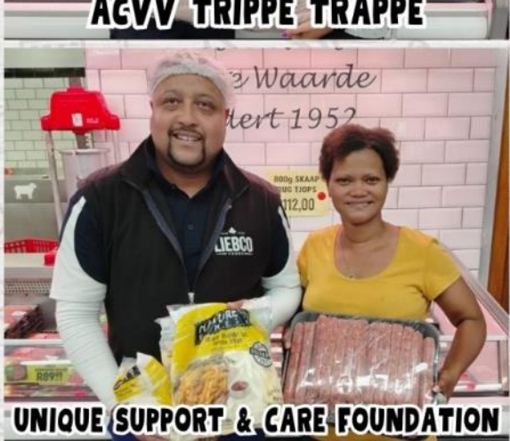
UNIQUE SUPPORT & CARE FOUNDATION

GAAN VOLG ONS OP LIEBCO VLEISHANDELAARS SE 'FACEBOOK & INSTAGRAM' OM OP HOOGTE TE BLY MET DIE NUUTSTE AANBIEDINGE.