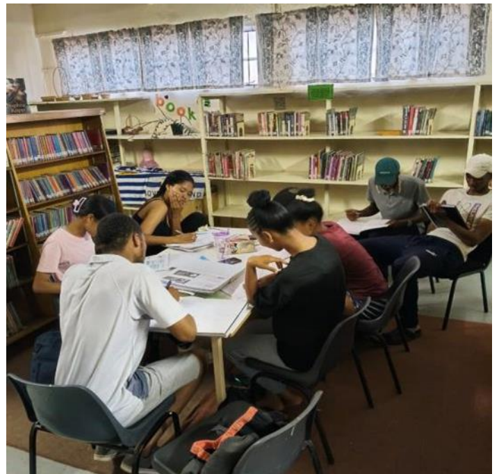
Steynville Sekondêre Skool matrikulante aan die werk in die biblioteek op hul tuisdorp, Wittewater.

Kollegas van Steynville Sekondêr wat in die omliggende dorpe bly, hou om die beurt toesig. Toesighouding word ook gedoen deur plaaslike inwoners en oud-leerders. SSS se personeel is dankbaar teenoor elke instansie vir hulle geriewe, aan diegene wat toesig hou en aan diegene vir donasies in die vorm van versersings by sommige sessies.