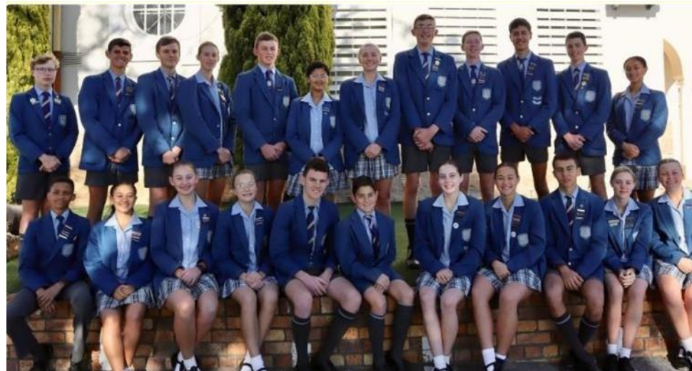
Hoërskool Piketberg se VRL vir 2025