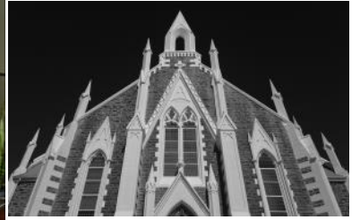
Anieka Möller behaal 'n 'Honourable Mention' by die PSSA American Youth Showcase 2024, vir haar foto 1 Thessalonians 5-11 by die PSSA America Youth Showcase 2024.