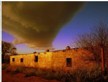
Tristan West behaal een aanvaarding by die '36th LUXEMBOURG International Youth Salon vir sy foto 'A Storm is Brewing'. Die groep 0-16: Jeug-fotografie van Suid-Afrika