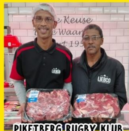
PIKETBERG RUGBY KLUB