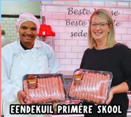
EENDEKUIL PRIMÊRE SKOOL

LIEBCO Express CITRUSDAL - CLANWILLIAM PORTERVILLE