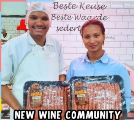
NEW WINE COMMUNITY OUTREACH