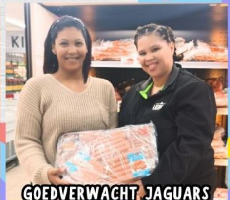
GOEDVERWACHT JAGUARS NETBAL