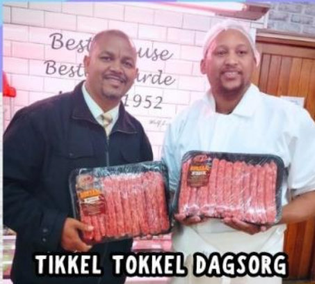
TIKKEL TOKKEL DAGSORG