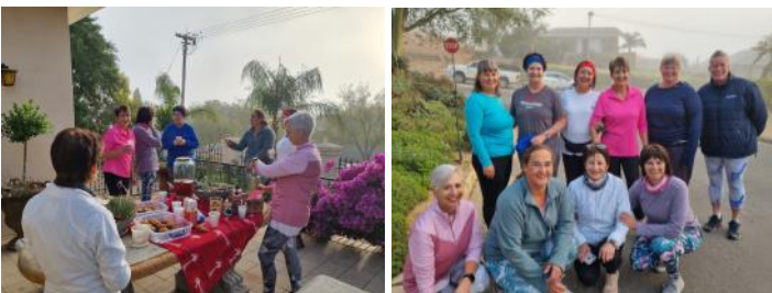
Op 'n baie mistige, koel 29 April 2024 stap 10 dames – VLV-lede en vriendinne saam deur Piketberg strate. Dit staan wêreldwyd bekend as Woman Walk the World – inisiatief van die Wêreld Bond van Plattelandse Vroue wat op 29 April gevier word. Almal het dit baie geniet en na die tyd lekker koffie en muffins by een van die dames se huise geniet. Dames het voorgestel dat die VLV somer elke maand so 'n geleentheid moet reël om saam te stap!